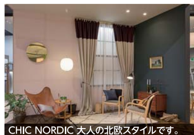
CHIC NORDIC 大人の北欧スタイルです。