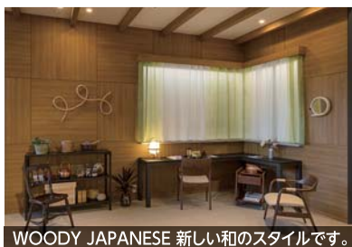
WOODY JAPANESE 新しい和のスタイルです。

サンゲツ東京品川ショールーム 〒108-0075 東京都港区港南2-16-4 品川グランドセントラルタワー4F TEL0570-055-134 FAX03-5463-6744